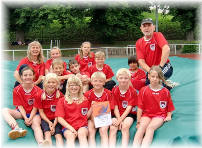
Siegerfoto der Schulmannschaft Leichtathletik- Sportfest 2012 im Eilse-Stadion BSA